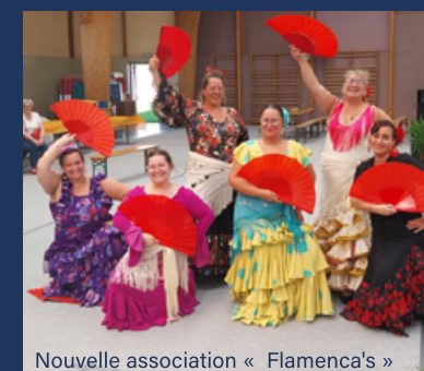
Nouvelle association « Flamenca's »

Rendez-vous incontournable des acteurs de la vie associative de notre territoire, 37 associations s'étaient donné rendez-vous de 10 h à 17 h le samedi 6 septembre au gymnase Daudet et à l'extérieur pour certaines d'entre elles.